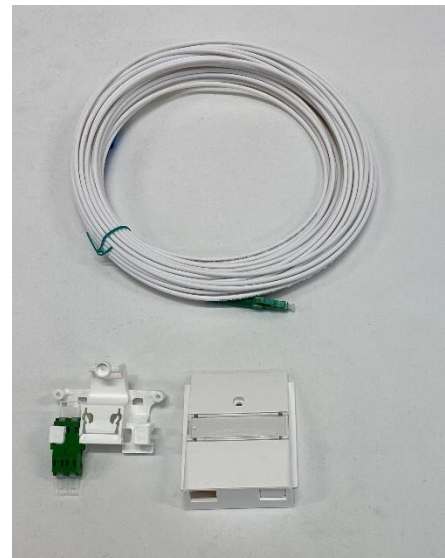
OptoUP Extension inkl. 1x LC/APC Du-Adapter SM 1x LC/APC Simplex Verbindungskabel 15m