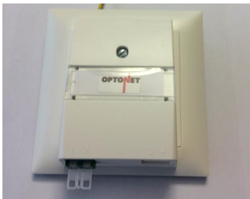
Extension OptoUP avec 1 raccord LC/APC Du SM 1 plaque de fixation 1x1 (non compris dans le set) 1 cadre de recouvrement EDIZIOdue (non compris dans le set)