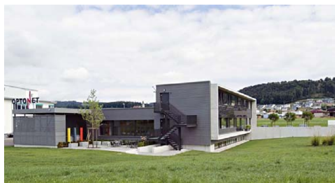
Ansicht aus Nord-Osten